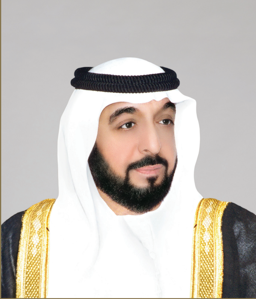
المغفور له بإذن الله الشيخ خليفة بن زايد آل نهيان تغمده الله بواسع رحمته