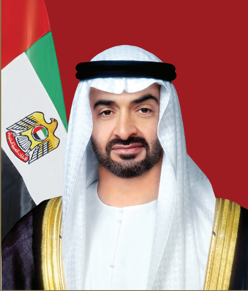
صاحب السمو الشيخ محمد بن زايد آل نهيان رئيس دولة الإمارات العربية المتحدة